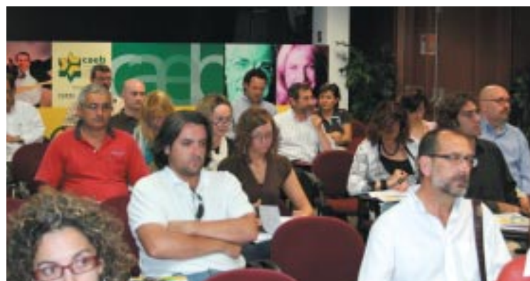
Más de 60 profesionales siguieron atentamente la jornada.