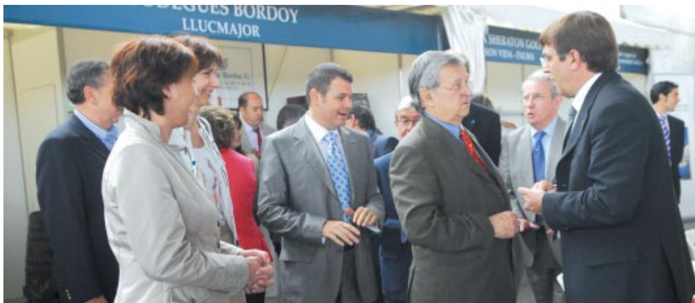
Autoridades presentes en el acto de inauguración de la XXIV Mostra de Cuina Mallorquina.