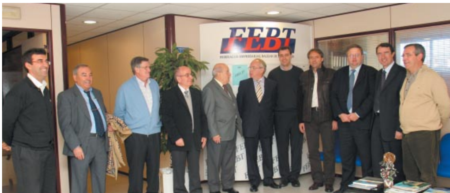
Foto de familia de la Junta Directiva de la Agrupación del Servicio de Transporte Discrecional de Viajeros de Baleares.